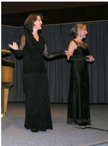
Amüsam: Die Amusetten sorgten für Heiteres aus der Welt der Männer und Frauen.