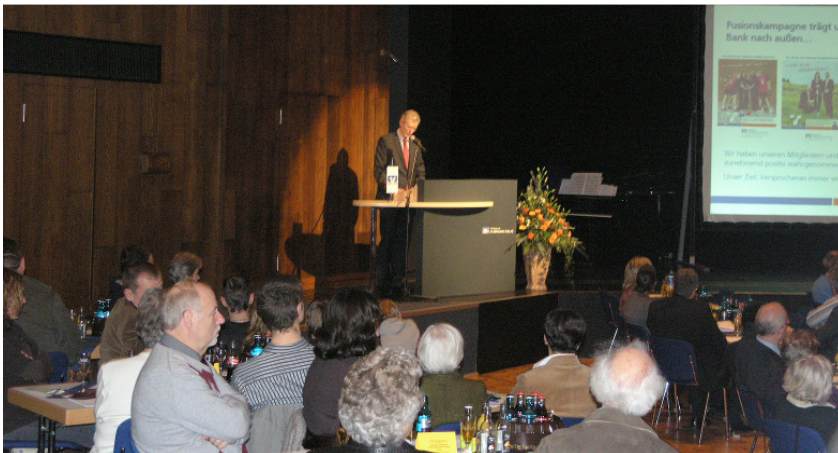
Die Mitglieder informierten sich über die neue Volksbank.

Die gute Stimmung der Mitglieder zeigte eindeutig, dass die Volksbank mit den Mitgliederversammlungen den richtigen Nerv getroffen hat: eine offene, klare Präsentation der Entwicklung der Bank, die Nähe vor Ort und die Einbindung der Mitglieder in den demokratischen genossenschaftlichen Mitbestimmungsprozess wurden sehr positiv aufgenommen.